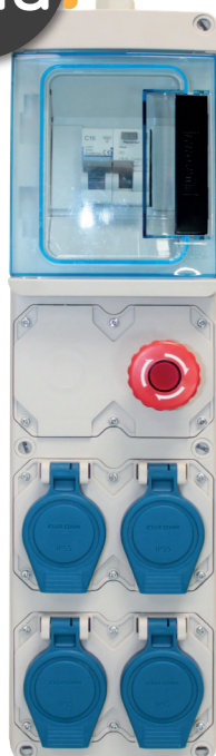
192 04 IP55 IK07