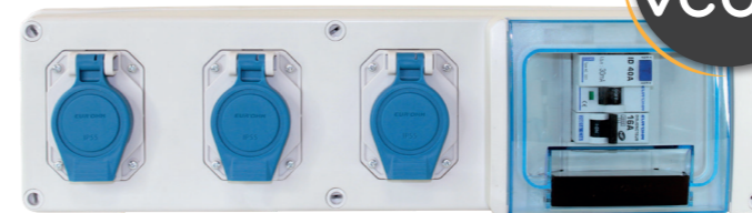
192 02 IP55 IK07