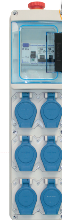
192 09 IP55 IK07