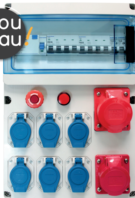
192 12 IP44 IK07