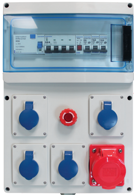
192 10 / 192 11 IP44 IK07